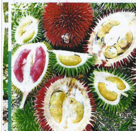
Antara durian spesies endemik yang terdapat di kawasan hutan Sabah dan Sarawak. Gambar kiri seorang pelancong asing bergambar dengan pokok durian kura-kura.