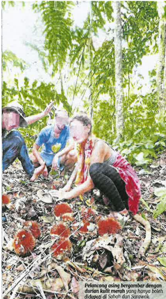
Pelancong asing bergambar dengan durian kulit merah yang hanya boleh didapati di Sabah dan Sarawak.