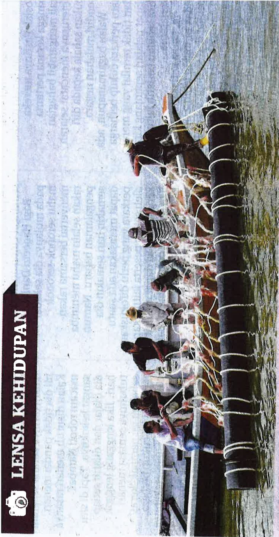
SEKUMPULAN nelayan bergotong-royong melepaskan pelampung untuk ternakan kupang tidak jauh dari Jeti Nelayan Sungai Semilang, Kuala Selangor, Selangor, baru-baru ini.