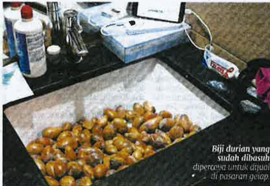
Biji durian yang sudah dibasuh dipercayai untuk dijual di pasaran gelap.