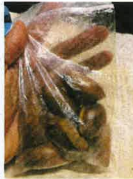
Biji benih durian kura-kura yang dijual pelancong asing.