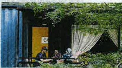
LAPANG masa bersama keluarga dalam suasana hijau.

dengan pemandangan menarik berlataran tasik berdekatan, pepohon hijau dan suasana yang nyaman.