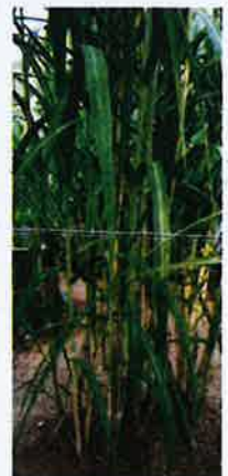
Tebu telur diusahakan petani di Kelantan.

Sangkar menggunakan kaedah pulas bagi memudahkan penternak ketika hendak mengambil ikan yang mencapai tempoh matang. Danau To Uban sesuai ditemak ikan peyuyu kerana kedalaman air sehingga 8 kaki.