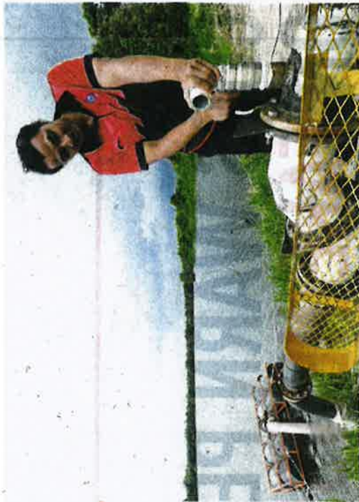
A Syarikat Air Melaka Bhd worker preparing to pump water from Tasik Biru in Jasin yesterday.

Present were state Tourism, Heritage and Culture Committee