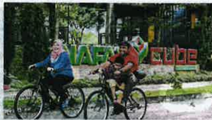
AKTIVITI berbasikal bersama keluarga meredah ladang penyelidikan pertanian.

"Oleh itu, kami mengambil inisiatif menyediakan lokasi dan aktiviti riadah bagi warga kota bersantai hujung minggu yang bukan saja eksklusif, malah tenang