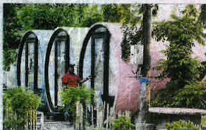
KEMUDAHAN penginapan selesa untuk pengunjung jauh.