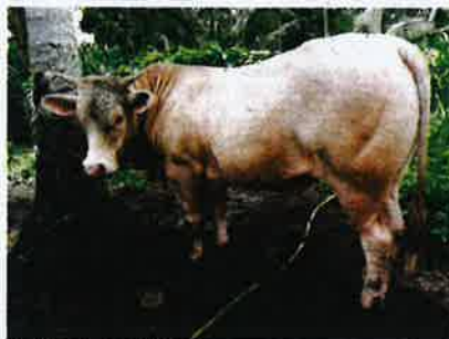
Lembu sado berusia satu tahun enam bulan.