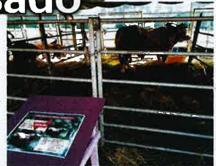
Lembu sado berharga RM28,000.