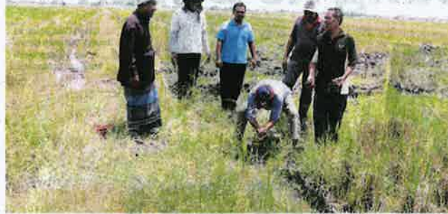
Pesawah di Kampung Matang Mahang, Jerun meninjau kawasan sawah mereka semalam yang sudah dituai beberapa hari lalu.

air yang usang kerana tidak ditukar sejak mula dibina pada 1970-an. Keadaan itu menyukarkan kami untuk kendalikannya," kata beliau.