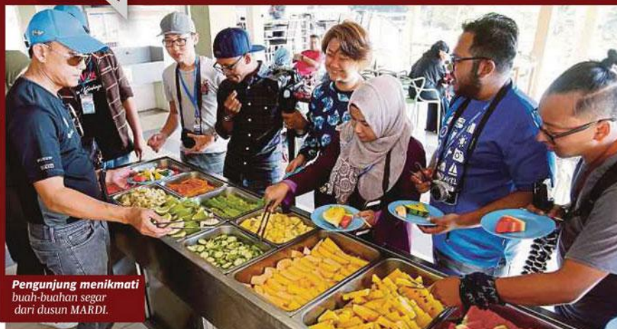
Pengunjung menikmati buah-buahan segar dari dusun MARDI.

100,000 (dalam dan luar negara). → Cawangan taman lain: Cameron Highlands, Cherating, Kuala Kangsar.