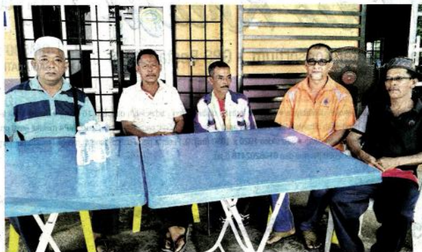
Petani berkumpul berbilang mengenai masalah mereka.

"Saya berharap kerajaan dapat membantu petani yang sangat memerlukan bantuan disebabkan musibah penyakit yang mengancam hasil padi mereka ini," katanya.