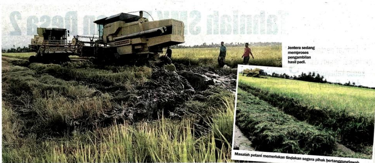
Jentera sedang memproses pengambilan hasil padi.