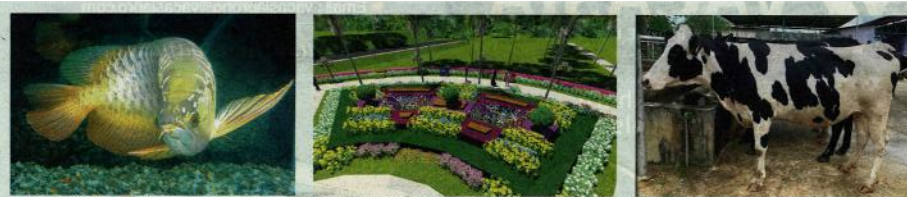
PENGIJUNG berpeluang melihat secara langsung anak lembu Australi Wagyu yang berusia enam bulan (kanan), ikan arowana (kiri) serta menikmati keindahan pelbagai jenis bunga di Laman Florikultur (foto tengah) di MAHA 2018.