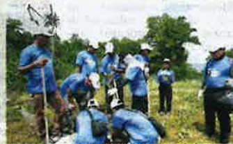
SEBAHAGIAN sukarelawan SIRIM menanam pokok ambung-ambung atau pokok penyu di pesisiran pantai di Pusat Konservasi dan Penerangan Penyu Pasir Panjang, Segari, Perak baru-baru ini.