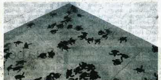
ANAK-ANAK penyu yang baru menetas di dalam kolam di Pusat Konservasi dan Penerangan Penyu, Pasir Panjang, Segari, Perak.

"Ia bagus dalam memberi ilmu mengenai kepentingan