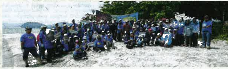
SERAMAI 130 sukarelawan menjayakan program Bersihkan Pantai Kita di Pusat Konservasi dan Penerangan Penyu Pasir Panjang, Segari, Perak baru-baru ini.