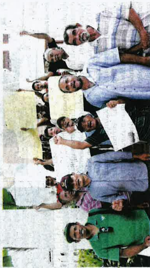
Nelayan Kuala Sebatu membantah sistem kultur laut di dasar laut yang didakwa menjejaskan hasil tangkapan laut mereka.

Menurut Zakariah, bantahan itu juga melibatkan kawasan penangkapan ikan dan udang yang didakwa menjadi sempit hingga menyukarkan lebih 100 nelayan kawasan ter-