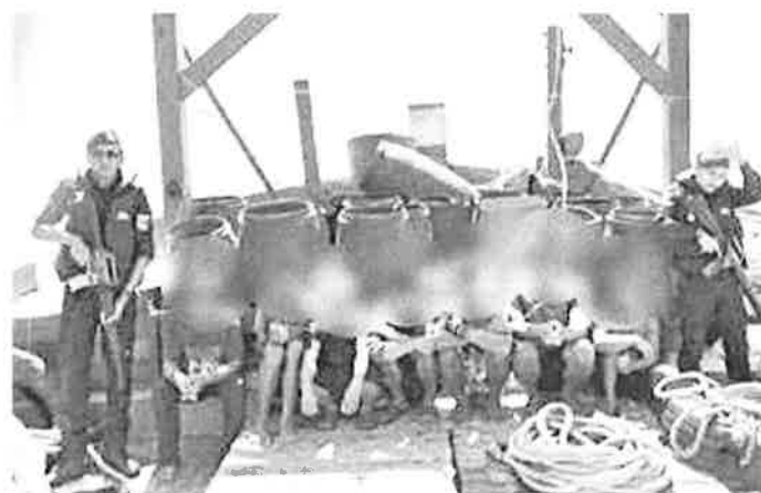
The boat skipper and the crew detained by the Marine Police Force in Lahad Datu.

The case is being investigated under Section 8 (b) of Fisheries