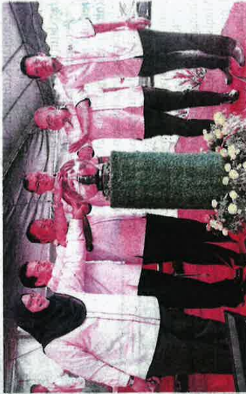
Azlan (tiga dari kanan) merasmikan Program Penemusuan Pengusahaan Harumanis Perlis Bersama Pemain Industri Sempena Promosi Mangga Harumanis Perlis di Tahun 2020 di Jabatan Pertanian Perlis Bukit Temiang, Beseri kelmarin.

harumanis bagi pasaran di dalam negara setiap tahun melebihi 3,000 metrik tan sedangkan Perlis mampu mengeluarkan hasil antara 2,150 metrik tan setahun.