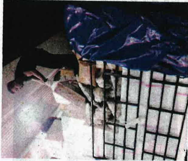
Anggota Maqis sedang memeriksa lori yang membawa kedua-dua keluaran pertanian tanpa dokumen yang sah pada Isnin lalu.

"Pesalah boleh dihukum di bawah Seksyen 11(3), akta sama yang boleh didenda tidak melebihi RM100,000 atau dipenjarakan tidak melebihi enam tahun atau kedua-duanya," katanya.