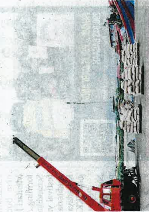
Maqis berjaya merampas 20 kontena berisi kacang tanah bernilai RM1.7 juta di Pelabuhan Klang Selatan.

"Tindakan kompaun di bawah Peraturan Perkhidmatan Kuarantin Dan Pe-