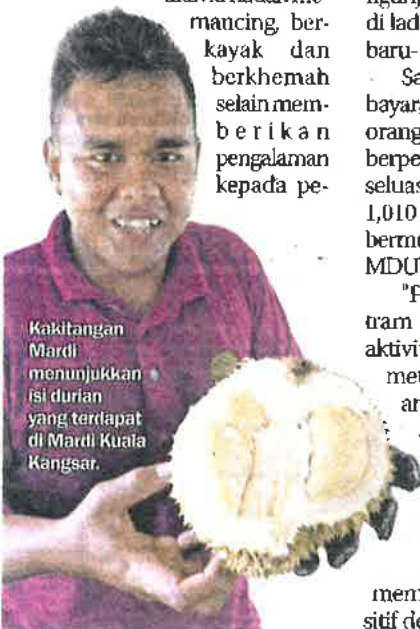
Kakitangan Mardi menunjukkan isi durian yang terdapat di Mardi Kuala Kangsar.

aktiviti riadah memancing, berkayak dan berkhemah selain memberikan pengalaman kepada pe-