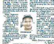
KERATAY Utusan Malaysia semalam.

Padi Black Madras: Penduduk petani terkejut