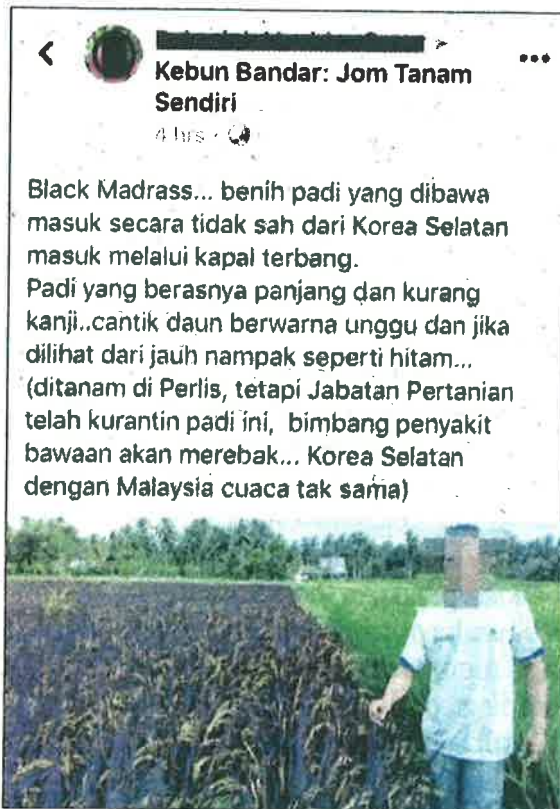
Gambar yang tular di Facebook.

Menurutnya, pihaknya menasihatkan peladang agar sentiasa menggunakan benih padi sah yang diiktiraf dalam negara.