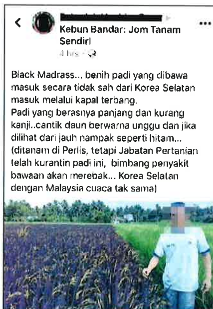
Gambar yang tular di Facebook.

Menurutnya, pihaknya menasihatkan peladang agar sentiasa menggunakan benih padi sah yang diiktiraf dalam negara.