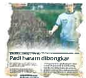
Padi haram dibongkar

Semalam, Jabatan Pertanian Negeri Perlis membongkar kegiatan penanaman padi Black Madras, sejenis padi asing berwarna hitam yang dikatakan dari Korea, yang ditanam secara ha-