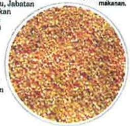
HASIL tuai jagung bijian diproses untuk dijadikan produk makanan.