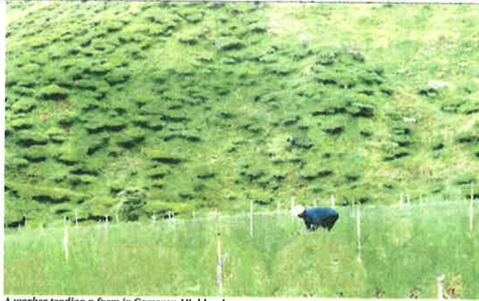
A worker tending a farm in Cameron Highlands.

Big greenhouses stretch across the countryside, usually white for the best reflection. They glint when the sun shines, and em-