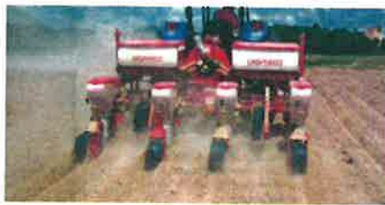
PROJEK penanaman jagung bijian perlu dilaksanakan menggunakan kaedah mekanisasi sepenuhnya.

Jagung Bijian diwujudkan bagi mengurangkan kebergantungan terhadap import.