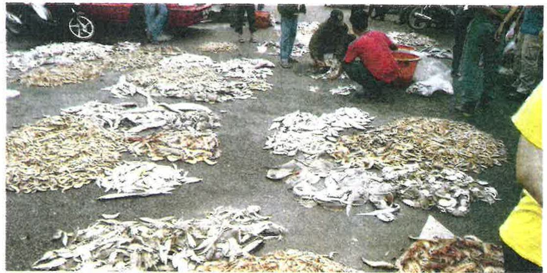
GAMBAR lambakan udang di Pasar Dungun yang tular di Facebook pada bulan lalu.

Ketika ini, udang bersaiz sederhana dijual RM20 sekilo (anggaran 25 ekor), udang putih sedang pula RM55 sekilo (anggaran 10 hingga 15 ekor) dan udang harimau (RM80 sekilo).